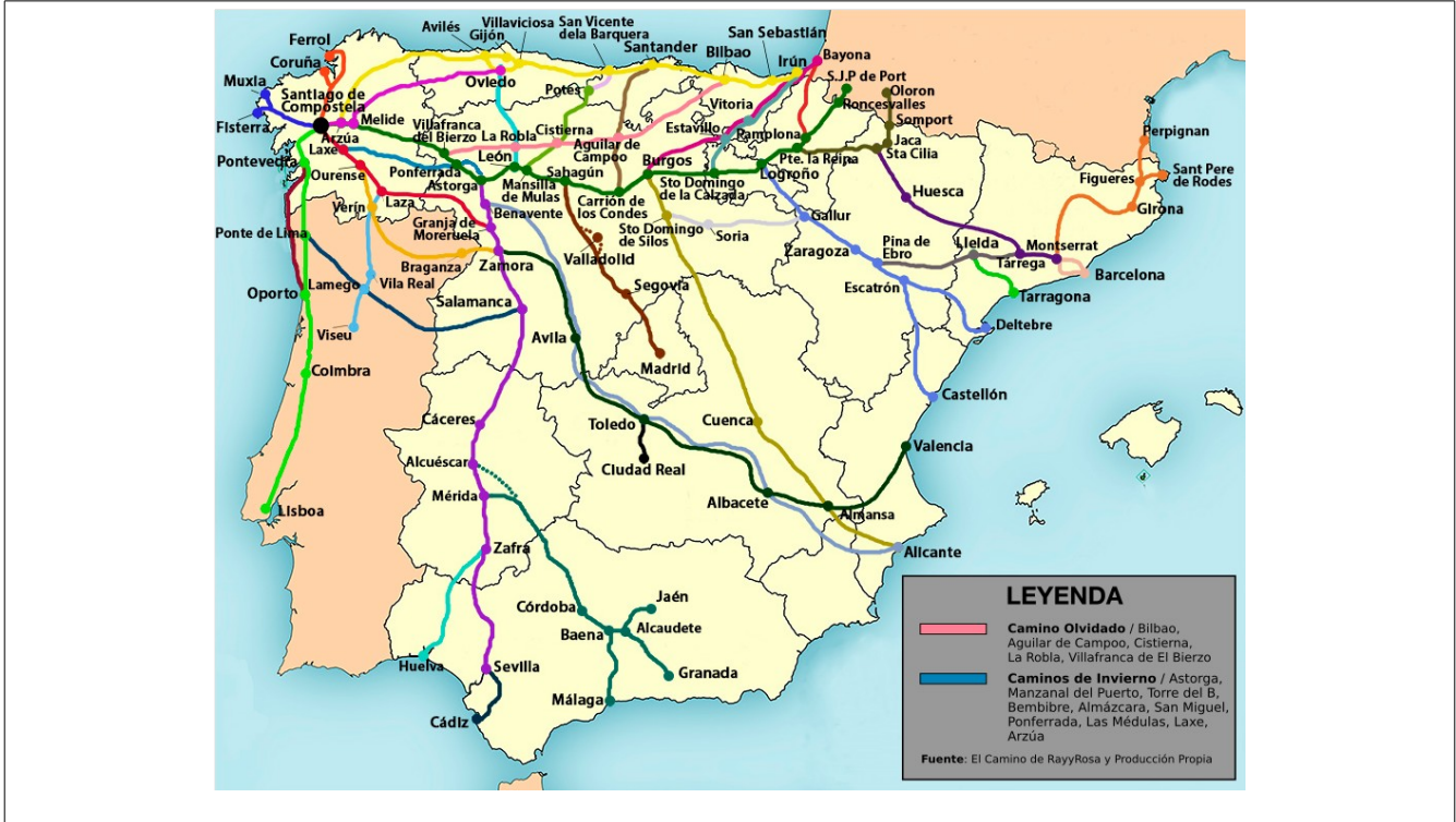
Fig. 2. Caminos de Santiago - Península Ibérica