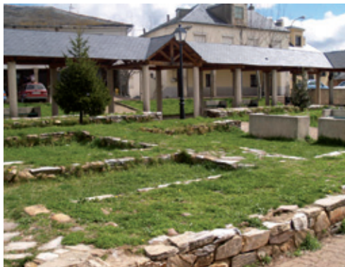
Vestigios del castillo (s. XVI)

Aliste, Diego Enríquez de Guzmán (1490-1550). Y que permiten al visitante llegar a hacerse una idea aproximada del alzado que tuvo en su día este pujante bastión.