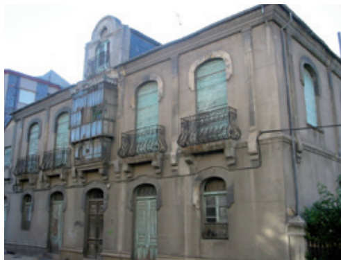
Casa de Criado (1910)

Excelentes son igualmente la forja de los balcones y las tallas de varias puertas interiores.