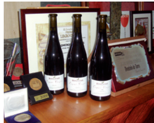
Vinos de “ Dominio de Tares ”

Los blancos tienen un mercado mucho más restringido, pero el “ godello ” y la “ doña blanca ” son de auténtica calidad.