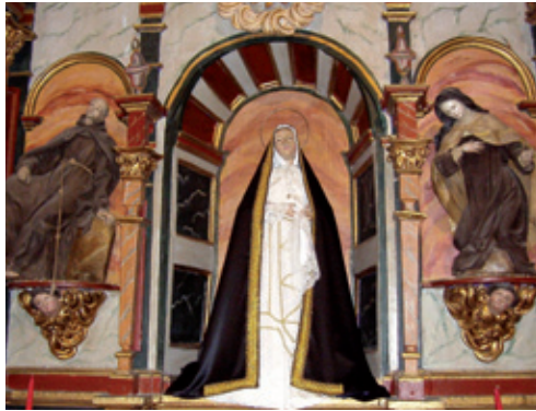
Tallas del altar de Ntra. Sra. de los Dolores

Los retablos colaterales son neoclásicos y fueron traídos en 1844 del desamortizado Convento de Santa M a Magdalena, de Cerezal de Tremor.