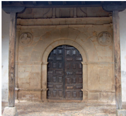
Portada de la Iglesia de Santibáñez del Toral

La iglesia , dedicada a San Juan Evangelista, es de una nave, con cúpula sobre el crucero. La portada meridional, de un elaborado estilo purista, fue erigida en el s. XVI.