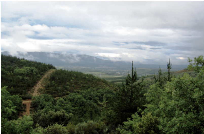
Paisaje de ensueño de la vega de Bembibre

Su microclima, asociación de la influencia atlántica y mediterránea, hace posible una gran diversidad vegetal y florística, con una