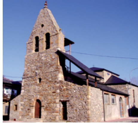
Iglesia de San Román Mártir (s. XIX)

Santiago. También perdura un escudo barroco del s. XVIII perteneciente al linaje de sus antiguos propietarios.