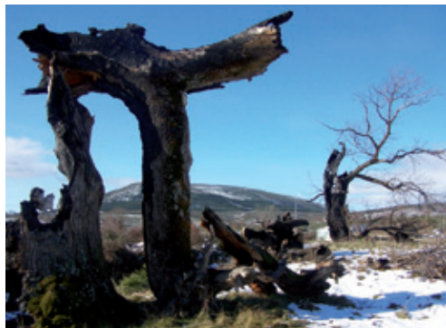
Horizonte de silencio

El relieve que configura este itinerario encierra una tierra cargada de misterios aún por desvelar, que nos acerca a un tiempo perdido, con testimonios de diferentes culturas, cuyas huellas permanecen visibles en las fértiles tierras de cultivo de Rodanillo y en los recónditos paisajes de montaña que ciñen Losada.