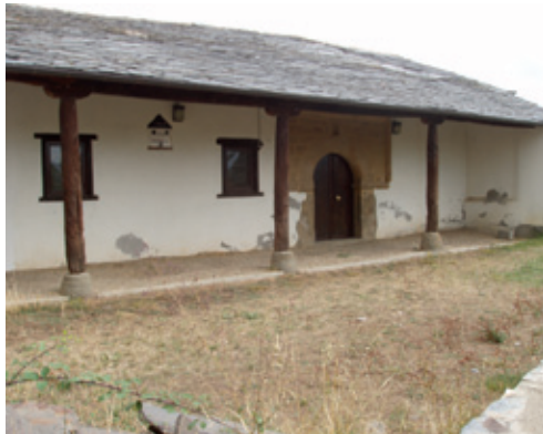
Antigua ermita de San Esteban Protomártir (s. XVI)

El retablo mayor, presidido por San Esteban Protomártir, tiene influencias del rococó, pudiendo fecharse a finales de s. XVIII. La policromía se debe al astorgano Francisco Ballesteros. El corpus iconográfico se enriquece con las tallas de San José y San Antonio de Padua, provenientes de un oratorio anterior. De esta misma corriente artística son las capillas colaterales de Ntra. Sra. del Rosario (con la imagen homónima y Santa Catalina Mártir, del s. XVII) y del Santo Cristo (con la escultura homónima y la de San Blas, del s. XVII). La cruz procesional fue realizada en 1790 por el platero Juan de Castro.