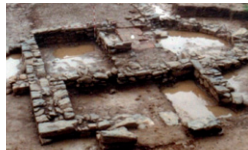
Villa romana de “El Parral”

de la “ Via Nova ”, a su paso por El Bierzo, y que dista de “ Asturica ” y “ Bergidum ” entre 30 y 20 millas, respectivamente, que se correspondería con la localización geofísica de San Román. El legado de Roma está presente en la villa altoimperial de “ El Parral ”, en el ara dedicada a “ Júpiter Óptimo Máximo ” y en la necrópolis del s. III d. C. soterrada en “ El Poulón ”, por reseñar las evidencias más significativas.