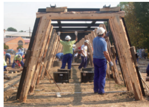
Concurso de entibadores

Pero si existe algo inherente a la Fiesta del Cristo es el concurso de entibadores mineros, que se convoca desde el año 1956. En poco más de una hora, por parejas, los entibadores tienen que demostrar su pericia en el montaje de un cuadro bajo una armadura metálica que simula la galería de una explotación minera, baremándose el labrado de la madera, el ajuste y las medidas, la alineación y, en definitiva, la perfección del cuadro, para designar a los ganadores.