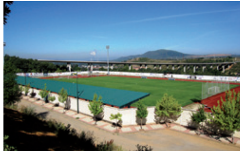
Polideportivo de “ La Devesa ”

El Polideportivo , de 1999, se asienta sobre el enigmático “ Campo de las Brujas ”, con canchas de fútbol, tenis y baloncesto, fosos de salto, pista de atletismo y también frontón, alrededor de un graderío cubierto con capacidad para 1.700 espectadores.