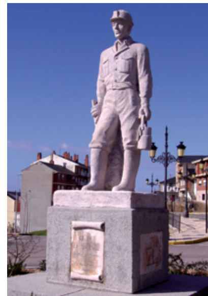
Monumento al Minero (1974)

Puentenuevo ”, nacido a la vera del viaducto de Las Ventas de Albares que, a través de un paseo arbolado, nos acerca hasta el suntuoso Santuario del Ecce Homo, muy próximo al Monumento al Minero, labrado en 1974 por el escultor Ángel Muñiz Alique, como reconocimiento al importante papel que ha jugado la minería en el progreso de esta Comarca.