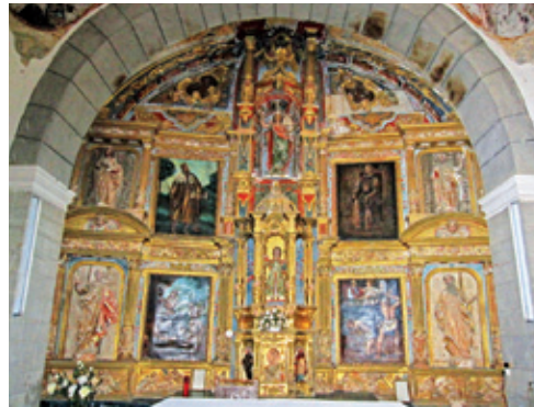
Retablo mayor (s. XVI)