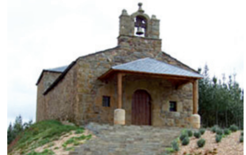
Ermita del Santo Cristo

Junto a las casas de solera tradicional y estructuras auxiliares, han llegado a nuestros días también algunas bodegas, cuadras y pajares, así como varios hornos de adobe y un lagar.