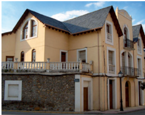
Casa de Santín (1932)

El reparto de huecos de la fachada parte de una disposición simétrica clásica, con evidentes influencias germanas. Dándose aquí por finalizada esta representativa muestra de arte historicista.