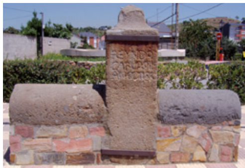
Pontón de Mojasacos (1786)

Nos alejamos de Bembibre con dirección a San Román por la avenida Villafranca, que se cimienta sobre el viejo Camino Real construido por Carlos Lemaur en el s. XVIII. Un fiel testigo de aquella época es el “pontón de Mojasacos”, que todavía conserva un monolito conmemorativo en el que reza la leyenda: “Reynando Carlos III. Año 1786”.