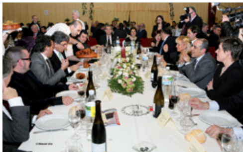
Festival Nacional de Exaltación del Botillo

mantenedor, se le encomienda ensalzar las bondades de tan succulento manjar.