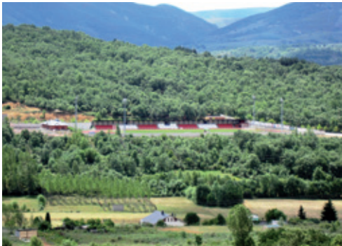
Vista de “ La Devesa ”

Prosiguiendo la marcha vemos ante nosotros praderas verdes, sotos de castaños y amplios robledales que se hacen más patentes en “ La Devesa ”, el verdadero pulmón de la villa, con especies de alto valor medioambiental.