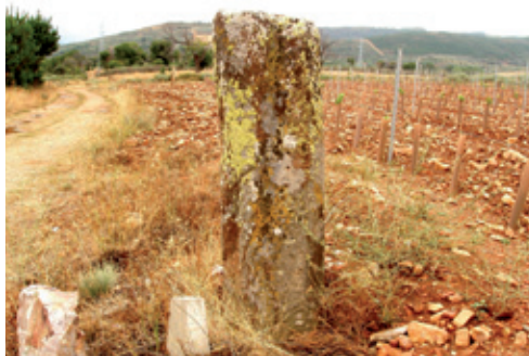
Miliario de Viñales

molinos, punzones y un capitel" , pero la evidencia más importante es un miliario de piedra caliza y forma cilíndrica, que se enclava en el camino de Viñales a San Esteban del Toral al que los más ancianos llaman "el yunque de los moros" .