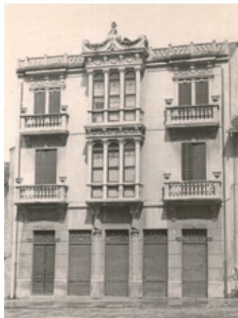
Casa de Villarejo (1919)

abren dos miradores centrales que se apoyan en cariátides y que están custodiados por balconadas señoriales con vanos dintelados que se sustentan sobre ménsulas, con una rica ornamentación barroca.