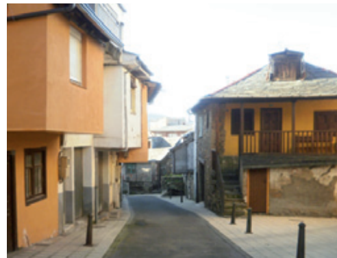
Casas de La Villavieja

que, como ya hemos mencionado, fue la génesis de la localidad. Enmarque que ha sido cincelado por el tiempo y la mano del hombre, con calles estrechas y empinadas que delatan su antigüedad y su regío pasado, con reseñables ejemplos de arquitectura popular.