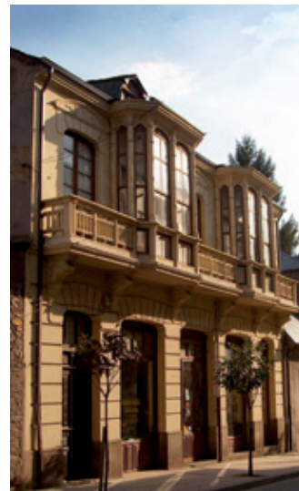
Casa de Reigada (1922)