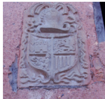
Armas de los “Gonzalez” (s. XVII)

En el s. XVIII el padre Martín Sarmiento menciona en uno de sus manuscritos que aquí pudo contemplar una estela dedicada a “ Tutelae Calvi ”; claro testimonio de su pasado romano.