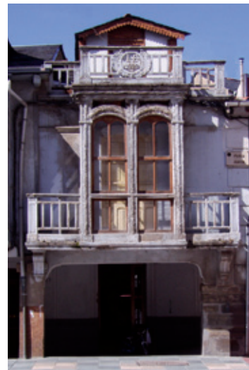
Casa de Riego (1928)