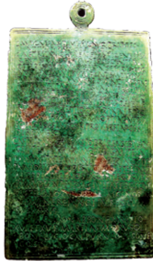
Bronce de Bembibre (15 a.C.)

conservan diferentes estelas en Arlanza, Noceda, San Esteban del Toral, San Pedro Castañero, Santibáñez del Toral, El Valle y Tedejo.