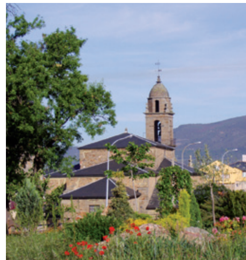
Santuario del Ecce Homo (s. XVII-XIX)

catafalco de difuntos del s. XIX, realizado con diversas jaculatorias, así como el viejo pendón del primer tercio del s. XX, la carroza realizada en el Taller de “Zacarías López” de Madrid en 1931, varias bulas e indulgencias que dan fe de los prodigios obrados por el Santo Ecce Homo, ornamentos y vestiduras sacras.