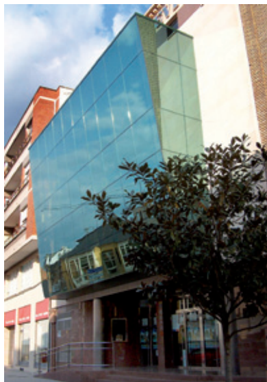
Teatro “ Benevivere ”

conforme va tomando altura, cerrando la composición arquitectónica un remate con novísimos canecillos.