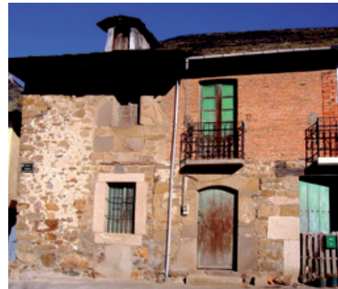
Casa solar de los "Cubero"

En la calle Murcia se hace preceptivo detenernos en la casa solar de los "Cubero" , edificada en los albores del s. XVIII y propiedad de Lázaro Cubero. Con una hechura de sólida mampostería y enlucido de cal, con vanos rectangulares, balconada de forja reformada y puerta de arco rebajado, que fue sede del ayuntamiento constitucional de Viñales entre 1812 y 1855.