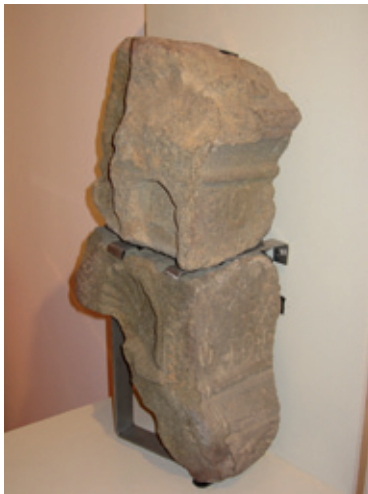
Ara consagrada a Cossus (s.II d. C.) Museo “Alto Bierzo”

El programa museográfico se divide en dos secciones: Arqueología y Etnografía, exhibiéndose piezas de gran valor.