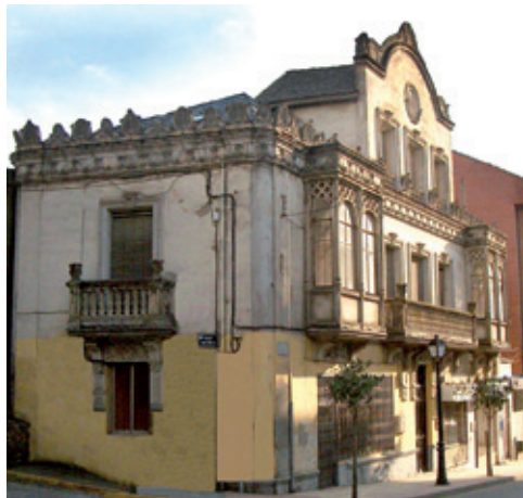
Casa de Cubero (1919)