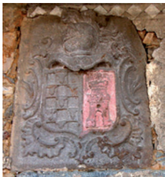
Escudo del Convento de Labaniego (s. XVIII)

En la Travesía de San Román nos recibe la “antigua escuela” , con féreos muros de mampostería. Sobre la fachada principal campea un escudo del s. XVIII traído del desarmonizado Convento de Labaniego, que le otorga un aire nobilar, con un espacioso corredor en la parte trasera.