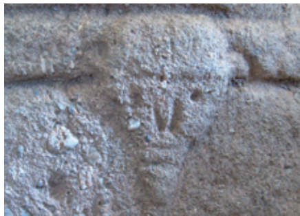
Ara votiva de Arlanza (s. II d. de C.) Museo “ Alto Bierzo ”

del Castro ”, “ El Pienso ”, “ La Susiella ”, “ Los Casares ” y “ Los Barredines ”, que ahora se ocultan y desdibujan entre la vegetación. Todo indicaría que aquí existió un templo astur que puede fecharse en el s. II d. de C., del que se ha rescatado un ara anepígrafe que muestra en el lateral izquierdo un rostro humano, que tal vez representaría a “ Cossue Segidiaeco ”.