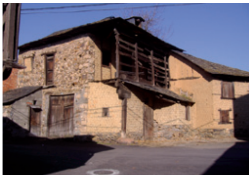
Casa tradicional de la calle de la Calzada

Junto al patrimonio señorial coexiste el marcadamente popular, con una variopinta muestra de casas, bodegas, cuadras y pajares, así como un lagar, un palomar y un molino.