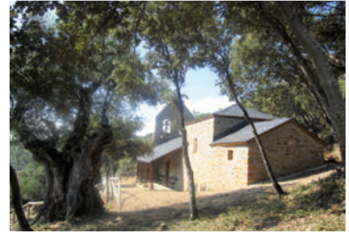
Iglesia de Santiago Apóstol (s. XVII)

soberbio enmarque natural que nace a sus pies. En la actualidad ha sido restaurada por la Junta Vecinal, destinándose a fines socioculturales. Presenta una sola nave con mayor altura en el presbiterio, espadaña en los extremos del campanario y acceso a través de un pórtico lateral sustentado con pies de madera.