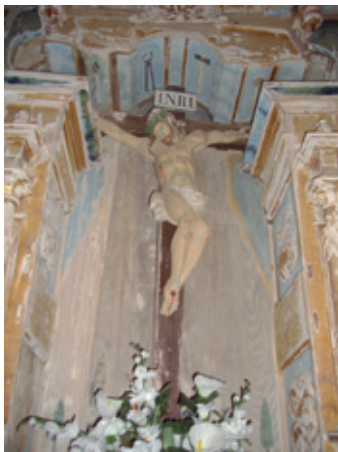
Talla del Santo Cristo (s. XVI)

Ya a las afueras, en la calle de los Huelmos, cierra el corpus sacro la ermita del Santo Cristo .