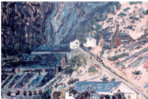
La Mina. Amable Arias Yebra (1957). Museo "Alto Bierzo"

En ellas se disponen piezas etnográficas de diversa utilidad y variada procedencia fechadas entre los siglos XIX y XX, garantes del devenir socioeconómico de esta Cuenca. El recorrido por las diferentes salas nos traslada por un momento en el tiempo, y a buen seguro que vendrán a nuestra memoria recuerdos y vivencias de otras épocas no tan lejanas, que la imaginación hará presente por unos instantes.