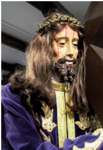
Jesús Nazareno (s. XVII) Museo de Arte Sacro “El Santo”

En sus dependencias podemos admirar algunos de los majestuosos pasos que se procesionan durante la Semana Santa, con una cronología que va del s. XVII al XX, siendo la talla más preciada la de Jesús Nazareno, del s. XVII. Una imagen de vestir, de gran realismo, que tuvo en su día altar propio en el Oratorio y que ahora se integra en el paso de la Verónica.