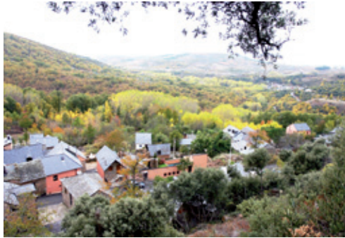
Vista de Labaniego

Llegamos a este enclave de ensueño que es Labaniego tras tomar la Carretera de la Diputación 127/7 (Bembibre-Noceda), dejando atrás la localidad de Arlanza. Encaramado a 800 m de altitud, dista 8,3 Km de Bembibre. Por lo abrupto de su orografía, las edificaciones se disponen a lo largo de la ladera del monte “ Sardonal ”, con alto valor paisajístico.