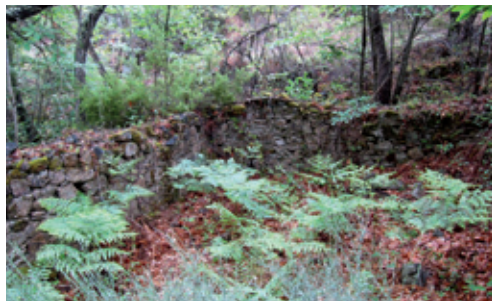
Ruinas del convento

de Padua, Jesucristo, Ntra. Sra. del Carmen y Santa Lucía Mártir. Con el paso del tiempo sus desmoronados muros han ido confundiéndose con la espesura del monte y poco dicen de la hegemonía que un día tuvo este crisol de cultos.