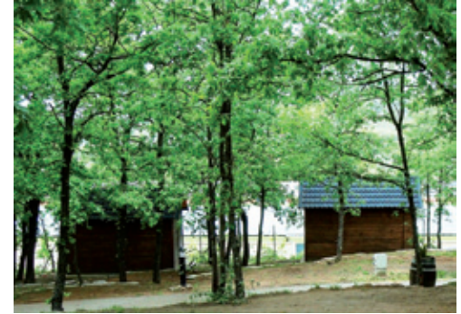
Camping de “ La Devesa ”

Muy cerca, a mano izquierda, se encuentra el Camping , abierto en el año 2004, que incluye en su oferta de servicios 12 bungalows, con zonas comunes como cafetería y terraza de verano, pudiendo establecerse aquí unos 200 campistas.