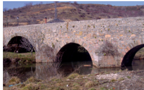
Puente de San Román de Bembibre (s. XVI)

Nos hallamos frente a un sólido puente de cantería de tres vanos de medio punto, siendo ligeramente más bajo el central, y tajamares dobles con remates escalonados. Se levanta en el año 1515 y se rehabilita en 1763, tras las continuas avenidas que poco a poco iban socavando su estructura.