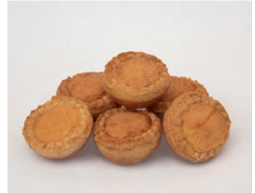
Cestitas de la Confitería “Ferrero”

Existe en Bembibre tradición confitera, endulzándonos la vida con productos artesanos, siendo típicas las “ cestitas ” de la Confitería “Ferrero” , hechas con hojaldre que se rellena con una fina yema y son muy conocidas también las “ almendras garrapiñadas ”, que ya se apellidan de “ Bembibre ”.