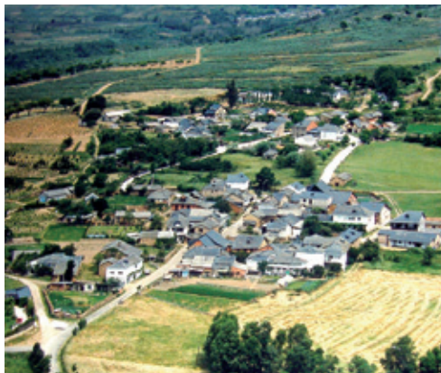
Vista de San Esteban del Toral

Volviendo sobre nuestros pasos, la Carretera de la Diputación 159/12 nos acerca a San Esteban del Toral, que se emplaza a 710 m de altitud y que dista de Bembibre 4 Km.