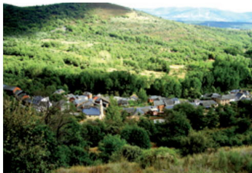
Vista de Arlanza

Río arriba, continuando por la Carretera de la Diputación 127/7 (Bembibre-Noceda) y a 6,9 Km de Bembibre, nos recibe Arlanza. Se emplazada a media ladera, en las proximidades del río Noceda, a 720 m de altitud.