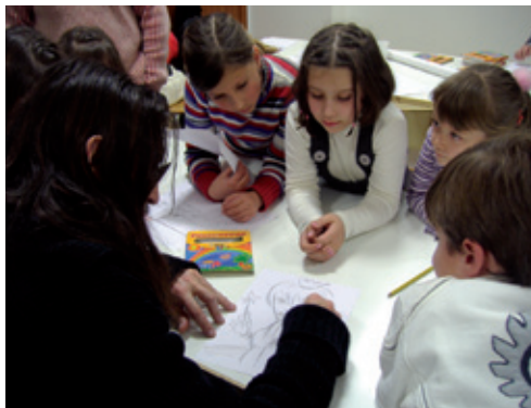
Taller de Dibujo

Además de este escaparate con mayúsculas que es el Museo, también se organizan exposiciones temporales sobre las distintas artes plásticas y muestras con diferente temática, que se completan con talleres didácticos y conferencias de interés.