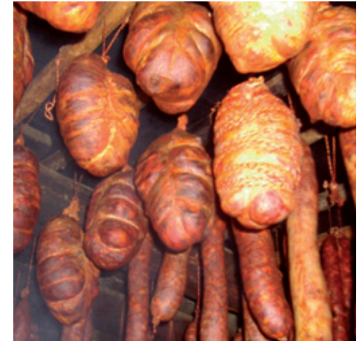
Botillos y otros productos de la matanza

Y ni que decir de la carne, con elaboradas y apetitosas recetas que tienen como base la línea de productos obtenidos del cerdo, que se preparan durante la matanza, de gran importancia en la economía familiar de los pueblos y que constituye todo un ritual, con un protagonista indiscutible: el botillo.