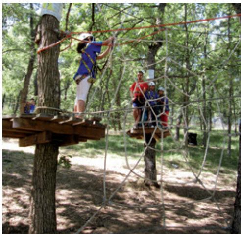
Parque Aventura “La Devesa”

instalado lianas, puentes levadizos y otros juegos que conforman circuitos de competición y entrenamiento. El trazado está ideado para que pueda realizarlo cualquier persona sin experiencia, contando para ello con monitores especializados que supervisan y hacen una demostración de las distintas pruebas para que después puedan ejecutarse de forma autónoma.