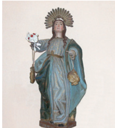
Imagen de Santa Lucía Mártir (s. XVII)

Nos recibe a la entrada de Labaniego la ermita del Santo Cristo, fundada en el s. XVI y reformada entre los siglos XVIII y XX. De su acervo iconográfico cabe resaltar las imágenes de Jesús Crucificado (s. XVII), Santa Lucía Mártir (s. XVII) y San Antonio de Padua (s. XIX).