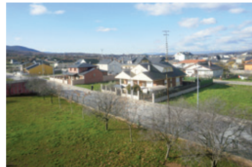
Vista del Barrio de Socuello

Aquí se encuentra el Parque “Madrid” con un área verde y juegos para los más pequeños.