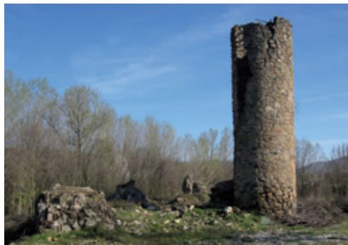
Vestigios de la vieja parroquia

Templo devastado también por un incendio fortuito acaecido en el año 1956, salvándose de las llamas parte de sus muros y un cubo circular que facilitaba el paso a la espadaña, así como algunos ornamentos litúrgicos de plata, entre los que merecen una mención especial la cruz procesional, de estilo gótico-renacentista cincelada en el s. XVI, y la custodia del s. XVIII. Da una idea de su importancia el hecho de que en el año 1676 este recinto sacro albergaba cinco altares y las capillas de San Nicolás Tolentino y Santa Catalina Mártir.