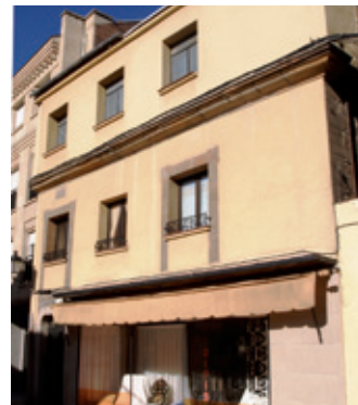
Mesón Real (1791)