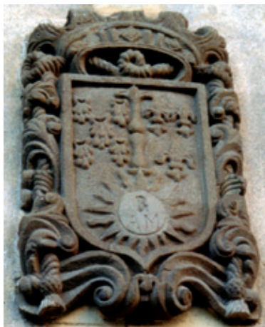
Escudo del convento de Cerezal de Tremor (s. XVII)

eventos culturales de distinta naturaleza y ofrece, esencialmente, funciones de teatro y veladas musicales, con dos salas de proyección cinematográfica.