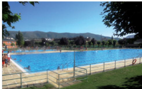
Piscinas de Verano

que se levanta sobre los terrenos cedidos por este excelso benefactor de la villa.