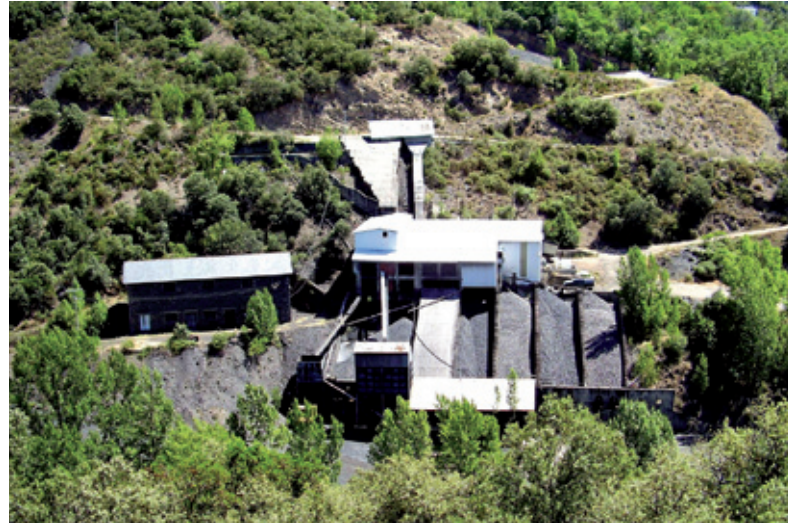
Carbones Arlanza, S.L. (Labaniego)

Actualmente la localidad tiene una industria poco diversificada, que sigue dependiendo, aunque en menor medida, de la actividad minera, con un polígono industrial consolidado que se proyecta como el futuro catalizador de la economía, así como varias empresas de construcción, junto con un preponderante sector servicios, derivado de su condición de capitalidad.