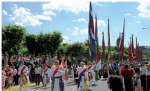
Salida del Santo (2008)

con un espléndido desfile procesional con el que arrojar la bajada del Ecce Homo desde su Santuario a la Iglesia de San Pedro Apóstol, y en el que las parroquias acuden con las cruces, estandartes y con los majestuosos pendones que parecen tocar el cielo, como reafirmación de nuestras señas de identidad, constituyendo todo un espectáculo admirar la maestría en su porte y manejo y la vistosidad de sus llamativos colores, como si de una postal se tratase.