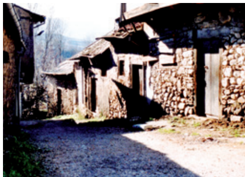
Arquitectura tradicional de la calle Vegarada

El Barrio de La Fuente es, desde el punto de vista histórico, el segundo en importancia, después del Barrio de La Villavieja. Se localiza en su costado meridional, en una ligera pendiente que da paso a la ribera del río Boeza y muy cerca de su cauce y de la avenida Susana González.