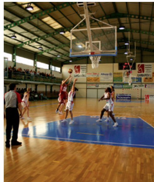
Pabellón de Deportes

Junto a la calle Arroyo Quiñones también se localiza el Pabellón de Deportes , inaugurado en 1992, y donde se practican varias disciplinas deportivas y que cuenta desde el año 1998 con un anexo polifuncional y con un Rocódromo, que permite practicar la escalada bajo techo. En este recorrido nos acompaña el discurrir de las aguas del riachuelo de “ Pradoluengo ”.