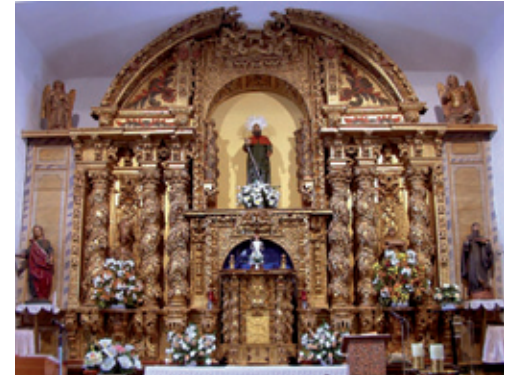
Retablo mayor (s. XVII)