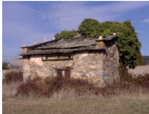
Palomar de San Esteban