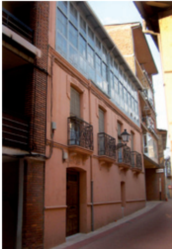
Casa de Davino (1921)

de Bembibre. Es una edificación de tres plantas construida en 1921, con un cuerpo macizo de dos alturas y una galería superior corrida de madera que se añadió tiempo después, sobresaliendo la forja de los balcones, la rica decoración en los vanos y las medianeras, de estimable factura.