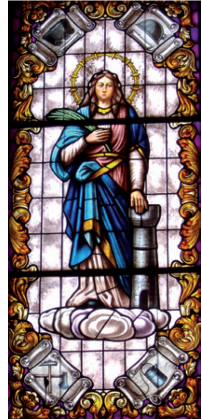
Santa Bárbara. José Luis Alonso (1982). Santuario del Ecce Homo

Santa Bárbara , el 4 de diciembre, invocada en otro tiempo por los campesinos para alejar las tormentas y evitar los daños del pedrisco y ahora como abogada y protectora de los mineros, siendo por ello fiesta local en algunas localidades del Bierzo Alto. Cuando en este día se canta la canción de Santa Bárbara los sentimientos afloran a ras de piel y al escuchar su desgarradora letra vienen a nuestro pensamiento quienes pagaron con su vida el tributo de la mina.