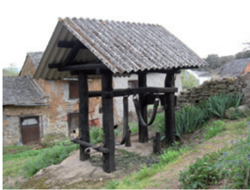
Potro de herrar

constituyendo un atractivo más para quienes se acercan a esta población. Otra parada obligada es la fuente con su lavadero y el potro de herrar.