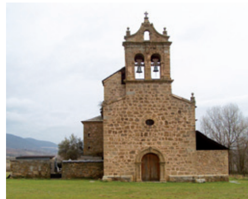
Iglesia de San Esteban (s. XVIII)