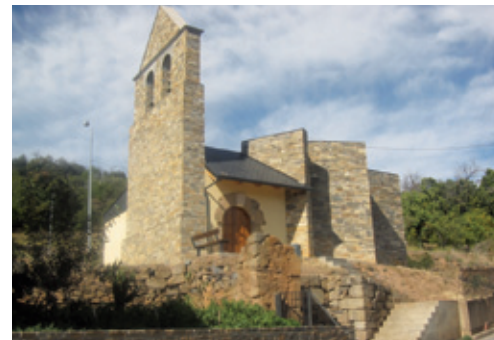
Iglesia de Arlanza

La secuencialidad cronológica nos traslada al paraje de “ El Campanario ”, que esconde celosamente una necrópolis de la Edad Media.