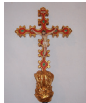
Cruz parroquial de madera (s. XVII)

efigie de la Virgen, que repite el modelo de Inmaculada que Gregorio Fernández realizó para la Catedral de Astorga, en tanto que la capilla colateral de Ntra. Sra. del Rosario data de finales del XVII o principios del XVIII. Las tallas de San Roque y el Santo Cristo nos remiten a la escuela manierista y pueden fecharse en el s. XVI. El templo cuenta también con una pila bautismal con motivos geométricos de principios del s. XVII y dos extraordinarias cruces parroquiales de esta misma centuria: una de plata y otra de madera policromada.