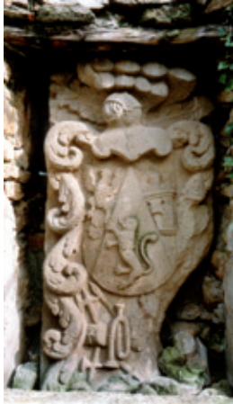
Armas de los “Robles” (s. XVIII)

después en exposiciones abiertas al público en general.