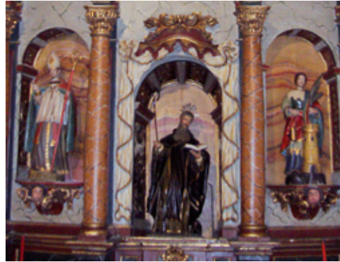
Tallas del altar de San Antonio Abad

artístico este último conjunto escultórico, que fue comprado en Madrid en 1855.