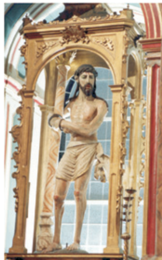
Imagen del Ecce Homo (S. XVI)

Este eremitorio fue destruido por el ejército francés el 2 de enero de 1809, iniciándose las obras de reconstrucción seis años más tarde, de ahí que la fábrica actual se circunscriba al s. XIX. La recuperación de su patrimonio iconográfico se inicia en 1825 con la reparación de las tallas del Ecce Homo y de San Antonio Abad por el dorador italiano Vicente Musio y no se completará hasta la década de 1860.