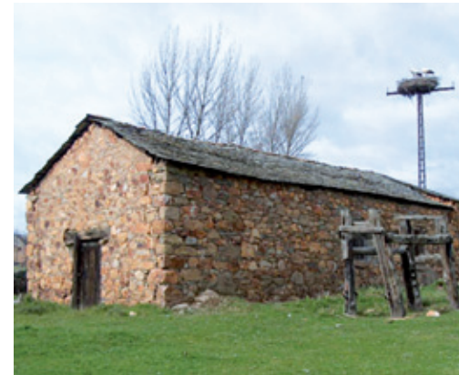
Lagar de la Era (s. XIX)

típicas, hornos de adobe, bodegas, cuadras, pajares, un potro de herrar, cuatro palomares, al igual que tres lagares, entre los que sobresale el de la Era, que formará parte de la Casa del Vino . Un ecomuseo donde poder asistir al proceso de transformación de la uva, habilitándose una bodega anexa en la que catar los selectos caldos bercianos.