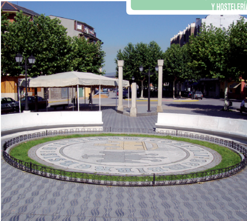
Plaza Santa Bárbara