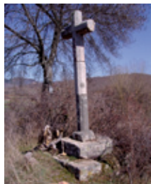
Cruz de Villanueva (1789)

El punto de encuentro en el que converge el caminante que, desde Bembibre, se dirige a Santibáñez y San Esteban del Toral es un sencillo crucero de piedra que perpetúa el recuerdo de la desaparecida ermita de Ntra. Sra. de Villanueva, y que podemos considerar a todos los efectos la puerta de entrada a Tierra Seca.