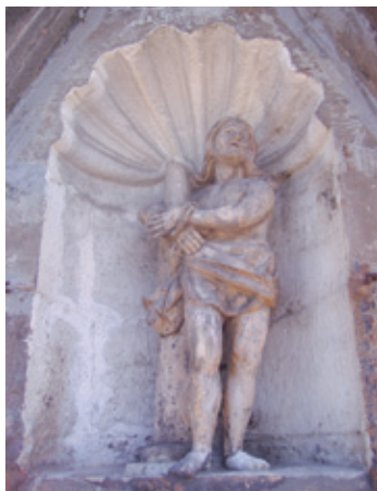
Ecce Homo de Velasco (1678)

y donde a diario pueden verse cirios encendidos y flores a modo de presentes.