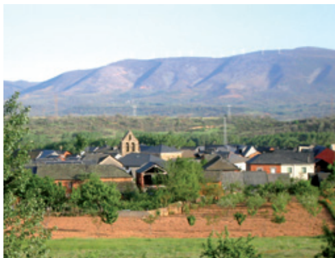
Vista de Rodanillo

Rodanillo es el primer pueblo que nos encontramos partiendo de San Román con dirección a Toreno. Se emplaza a 710 m de altitud y a escasa distancia de Bembibre, aproximadamente 4,2 Km, asentándose sobre una fértil planicie.