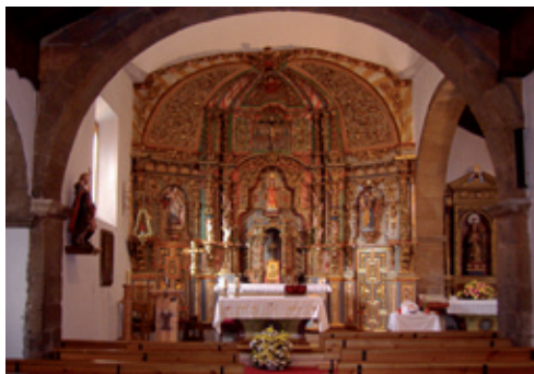
Retablo de San Antolín (s. XVIII)

El edificio que ha llegado a nuestros días es de dos naves con presbiterio de amplias proporciones, espadaña central de tres vanos y espacio porticado que enmarca la puerta de acceso. El retablo mayor, dedicado a San Antolín, es de estilo churrigueresco, de la primera mitad del s. XVIII, con un toque colorista que le aporta un mayor realce a su magnificencia.