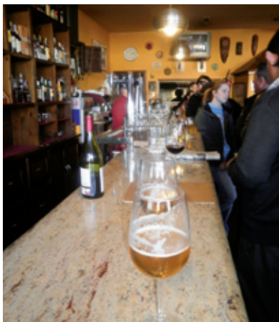
Ronda de Vinos

tirada o un botellín casi glacial de las marcas más cotizadas, con terrazas de verano muy concurridas.