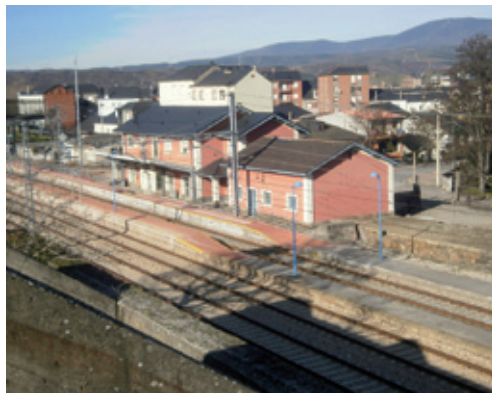
Estación del Ferrocarril

En el segundo tercio del s. XX están en plena producción 32 explotaciones mineras en los ayuntamientos del Valle del Boeza, incrementándose notablemente el volumen de facturación y recepción de mercancías. Esto hace que desde la corporación de Bemibre se proponga a la Dirección General de los Ferrocarriles del Norte de España la reforma y ampliación de la estación, construyéndose en el año 1941 unas tolvas para facilitar el almacenamiento del carbón y su posterior carga en los vagones del tren. Estructuras de hormigón armado que pueden contemplarse en la calle homónima.