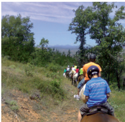
Paseo a caballo

divertirse todos los integrantes de la familia, con dos circuitos con diferentes grados de dificultad: uno infantil para “ Pequeños Aventureros ” y otro para adultos denominado “ Sensaciones ”. Entre las atracciones que nos esperan se encuentran: los puentes tibetanos, lianas de Tarzán, toneles suspendidos, tirolinas espectaculares de 60 m, pasos de oso, redes de abordaje, divertidas pasarelas y el temerario salto al vacío.