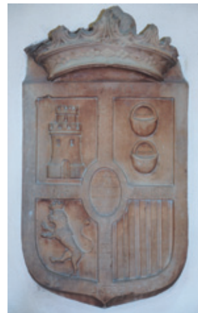
Escudo de los Condes de Alba de Aliste (s. XVII)

Era el establecimiento donde en el Antiguo Régimen se determinaba “ el peso y la medida oficial ” de los artículos que después se comercializarían en el mercado de la villa.