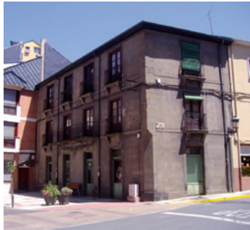
Casa de Sarmiento (1900)