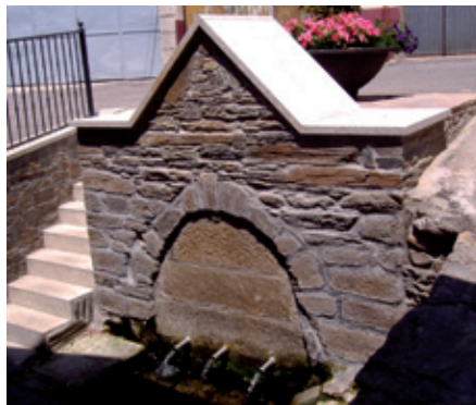
Fuente de los Caños

Debe su nombre a la existencia de un manantial conocido como “ la fuente de los caños ”, donde antiguamente los vecinos acudían para abastecerse de agua potable. Presenta una estructura de cantería con tres caños y un lavadero anexo.