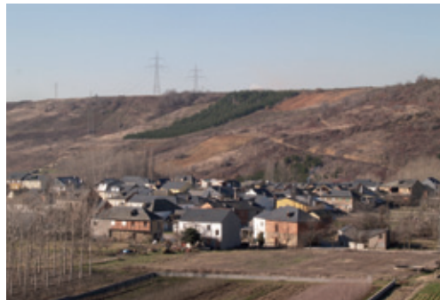
Vista de Viñales

La siguiente parada de esta ruta fluvial es Viñales, población ubicada a 650 m de altitud en un fértil valle, que se encuentra a 3,4 Km de la capital del municipio y a la que llegamos por la carretera de la Diputación 127/7, que va de Bembibre a Noceda.