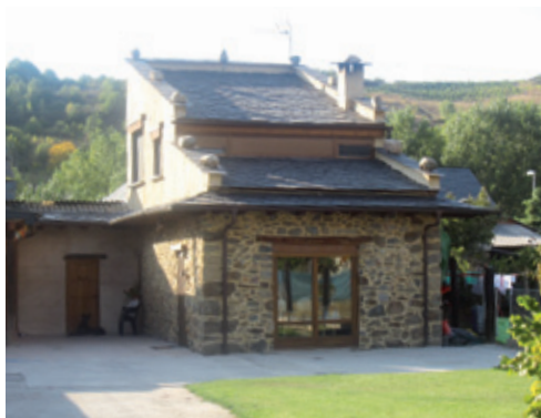
Palomar de Viñales

reformada en el s. XVIII, siendo rehabilitada prácticamente en su totalidad durante los últimos años. Es una edificación de mampostería y sillería en las esquinas, de dos plantas y bajo cubierta con buhardilla, en la que se abren diferentes vanos. La planta baja todavía conserva una puerta de acceso de medio punto y en la planta superior se dispone un amplio corredor.