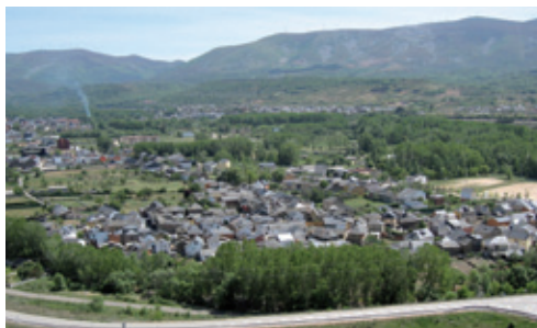
Panorámica de San Román de Bembibre

Dejando Bembibre, a escasos 2 Km, llegamos a San Román, que se sitúa a 630 m de altitud. Existen evidencias de su poblamiento desde el s. XII, transcribiéndose en la documentación como “ San Roman de Boeza ”.