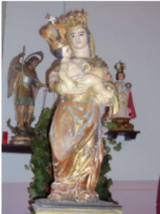
Ntra. Sra. del Rosario (s. XVI)

Poco antes de llegar al pueblo advertimos la nueva iglesia , consagrada a San Miguel Arcángel. La planta, de una sola nave, tiene el presbiterio en la cabecera, situándose la entrada en el frontis principal y el campanario a poniente. Acoge en su interior las tallas de Ntra. Sra. del Rosario, de finales del s. XVI, Jesús Crucificado, de mediados del s. XVII y Ntra. Sra. de los Dolores y San Antonio de Padua, ambas del s. XVIII.