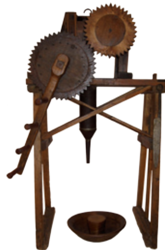
Embutidora Artesanal. Lorenzo González de Ron (1876). Museo “Alto Bierzo”

de útiles, entre los que es preciso destacar la colección de armas arrojadizas del Bronce Final, y la colección de aras votivas dedicadas a divinidades astures, como el dios “ Cossus ”, así como la réplica del conocido como “ Bronce de Bembibre ”, del que ya hemos hablado.