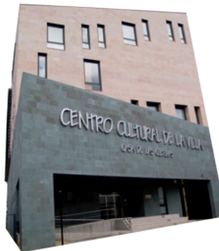
Centro Cultural de la Villa “ Casa de las Culturas ”

tradicionales, siendo lo más reseñable el blasón del s. XVII, que era el que campeaba en el ya desaparecido Convento de Cerezal de Tremor y que fue traído a Bembibre en 1938 por el sacerdote de la villa Ricardo Alonso Montiel para ornamentar dicha edificación.