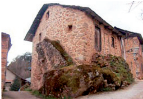
Casa sobre peña

XVI, San José con el Niño, del s. XVII, y Ntra. Sra. de la Asunción, imagen de vestir del s. XVIII, al igual que una pila bautismal del s. XVII.