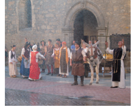
Escenificación de la “Misa del Milagro”

durante varios días, y retornándose a una meteorología favorable que trajo consigo una fecunda recolección.