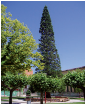
Secuoya del Parque de “ Enrique Gil y Carrasco ”