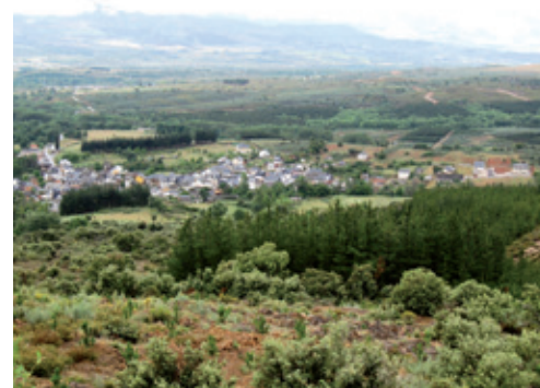
Vista de Losada

Tras abandonar Rodanillo nuestra próxima parada es Losada, que se sitúa a 740 m de altitud y que dista de Bembibre 6,9 Km.