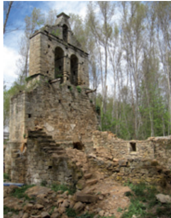
Ruinas de la vieja iglesia de San Miguel

La primitiva parroquia quedó arrasada a causa de la fuerte tormenta que se desató el 12 de agosto de 1964. Su emplazamiento, en un valle cerca del arroyo “ Lobo Forcado ”, hizo que, al desbordarse el caudal una enorme tromba de agua se precipitase sobre ella con toda su fuerza, abriéndose las puertas e inundando todo el recinto sagrado.