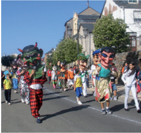
Gigantes y cabezudos

No hay lugar para la nostalgia, con alboradas y pasacalles, desfile de carrozas, verbenas a la luz de la luna, la magia y el colorido de los fuegos artificiales, espectáculos, teatro de calle... Y el popular “ Mercado del Cristo ”, en el Paseo de Carrizales.