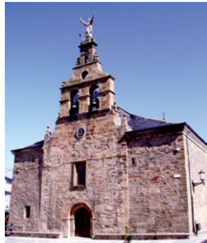
Iglesia de San Pedro Apóstol (s. XII-XVIII)

Azares del destino quisieron que se salvase un Crucificado renacentista de finales del s. XVI y una talla del Sagrado Corazón de Jesús del año 1921, indultada por los sublevados al llevar un manto carmesí, colgándole del cuello un cartel con la leyenda: “Cristo Rojo: A ti te respetamos por ser de los nuestros” .