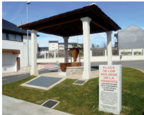
Plaza de los Molinos de la Pimienta

La arquitectura tradicional de carácter agropecuario e industrial también está representada, conservándose algunas bodegas, cuadras, pajares y un lagar. A lo largo de la Edad Moderna se erigieron sobre el curso de la denominada “ reguera de la fuente ” o “ moldera real ” varios “ ingenios de trituración y molienda ” destinados a la industria transformadora del cereal y del pimentón, resistiendo los envites del tiempo el “ molino de la Blanca ”, emplazado en el Barrio de la Fuente, junto a la plaza de los Molinos de la Pimienta.