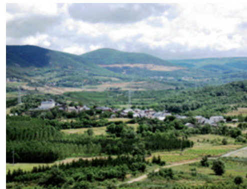
Vista de Santibáñez del Toral

Santibáñez del Toral es una población ubicada a 630 m de altitud y a tan solo 2,5 Km de la capital del municipio, con acceso a través de la Carretera de la Diputación 159/12 Bembibre-Rozuelo.