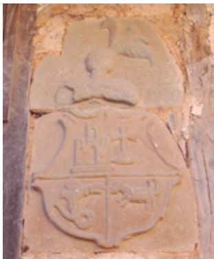
Armas de los “Gonzalez” (s. XVI)

señorial blasonada: uno en la calle del Pozo y otro en la calle de Arriba. En el primero la planta baja es de piedra y la superior de tapial y adobe, campeando en su frente un escudo del s. XVII, con cuatro alianzas y que por la leyenda que lleva inscrita es del linaje de los “González”.